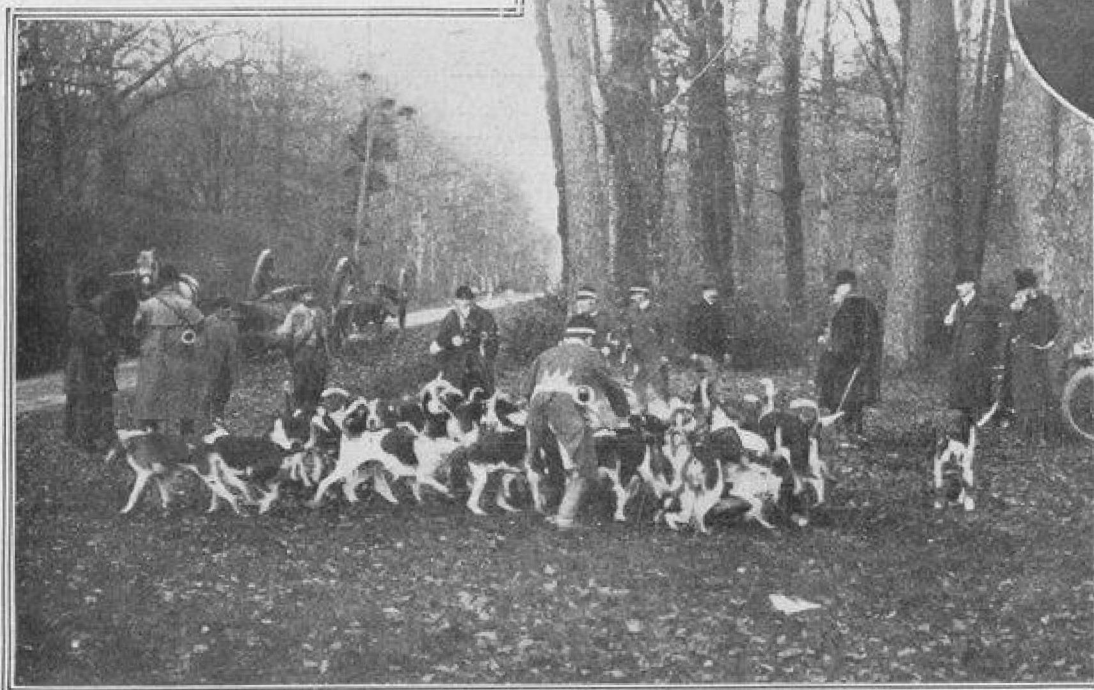
“ La curée. ”