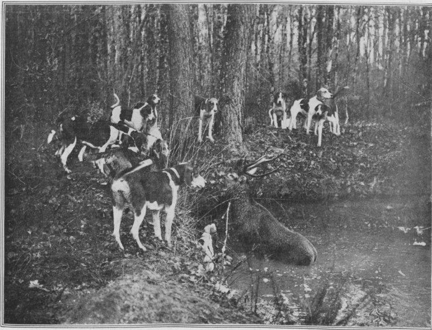
Hallali de Cerf, en forêt du Gâvre.